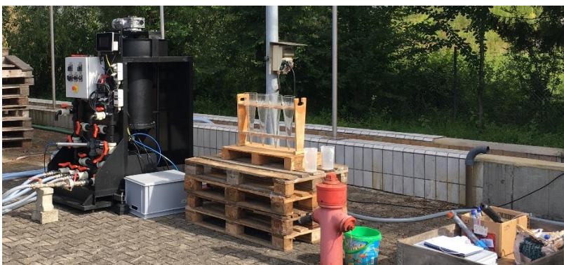
Versuchs-Aufstellung beim Sandfang