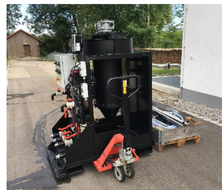
Transport mit Handhubwagen

Platzbedarf für die Aufstellung der Versuche ist ca. 2x3m sowie jeweiliger Zugang zur Entnahme von Abwasser mittels Tauchpumpe bei: